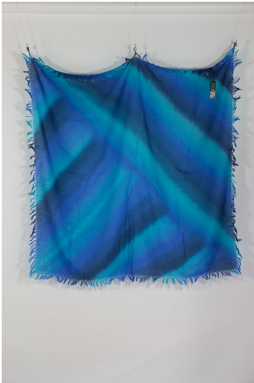
Foulard lana bio