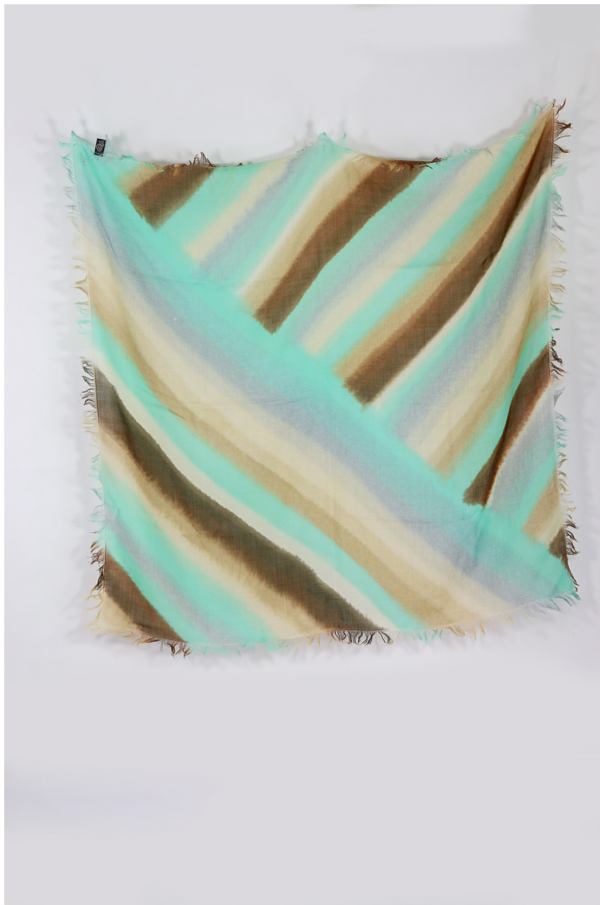
Foulard lana bio