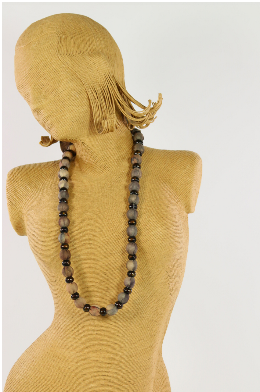
Collana lana bio