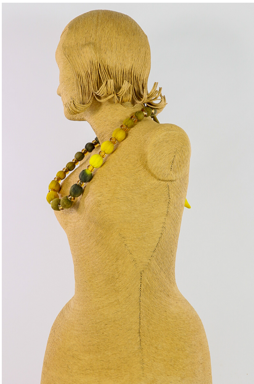
Collana lana bio