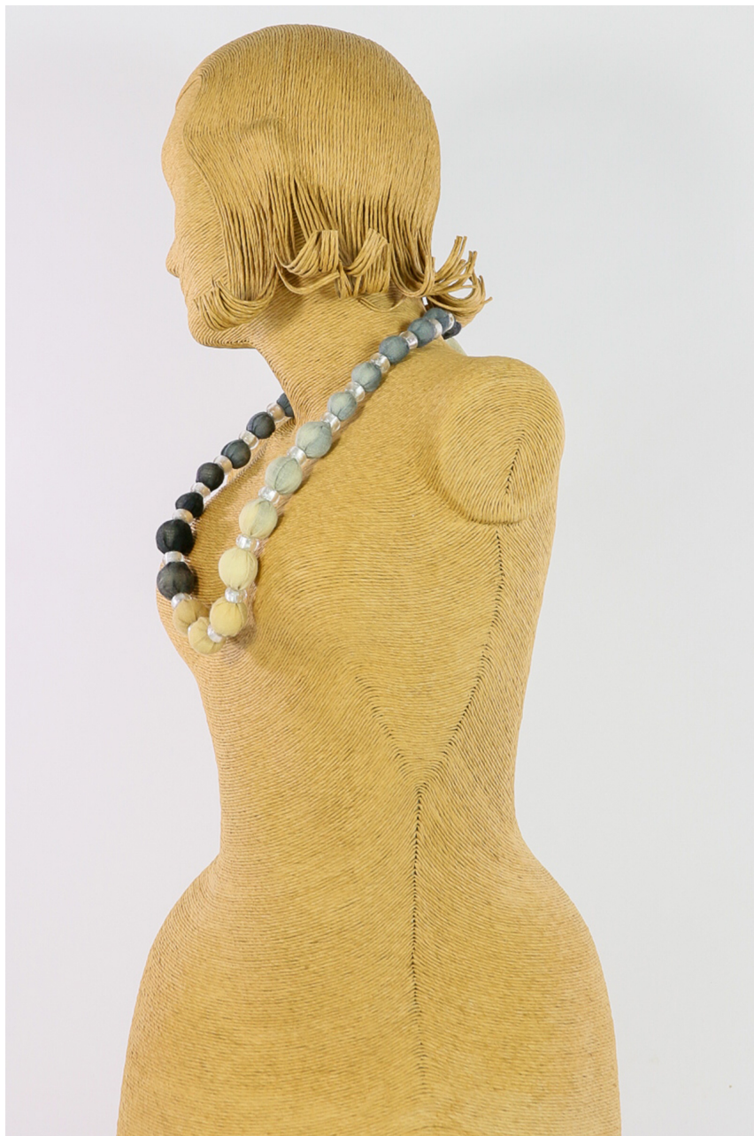
Collana lana bio