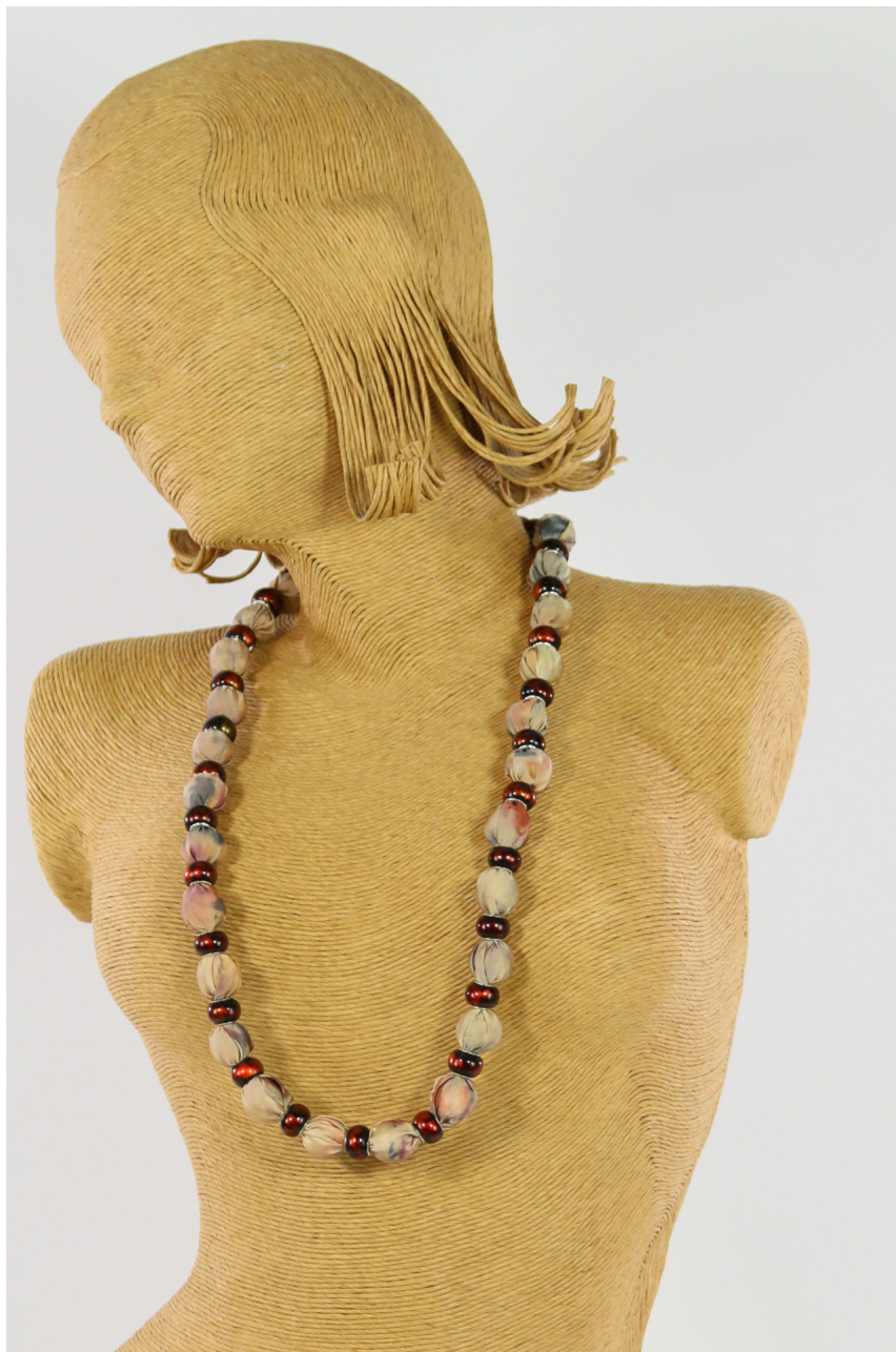
Collana seta della pace