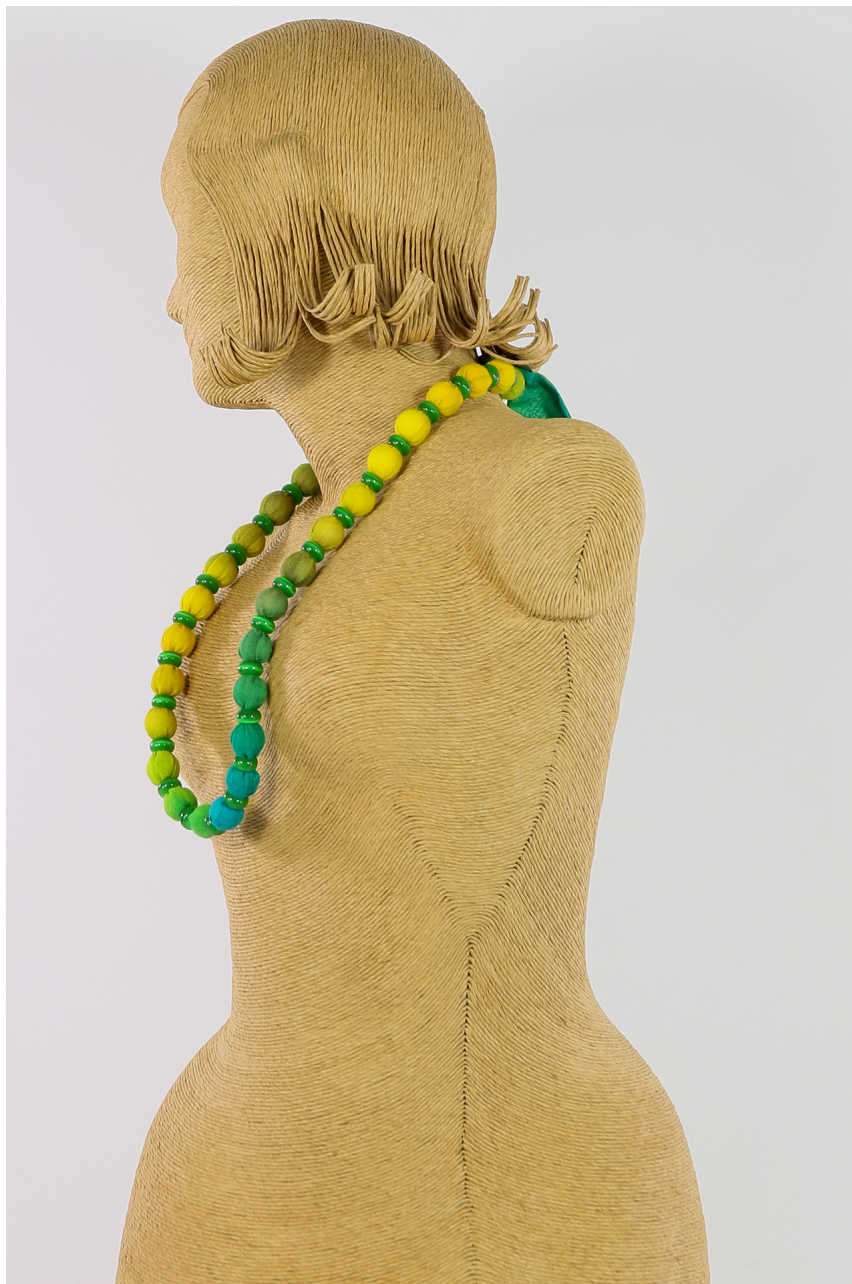
Collana lana bio