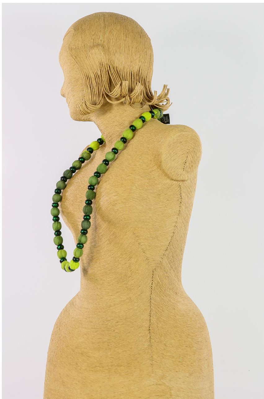
Collana lana bio